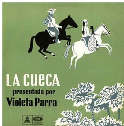
LP LA CUECA 1957