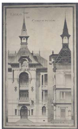
VOLUMEN DE ACCESO DESAPARECIDO

En su origen fue el auditorio del liceo más importante del sur de Chile. Fragmento de un edificio neoclásico que abarcaba toda la manzana, diseñado con la doble intención de transformarse en la sede de la futura Universidad de Concepción, situación que no se concretó luego del emplazamiento de ésta en un terreno periurbano, el que permitió implantar el modelo de campus universitario con edificios insertos en un gran parque.