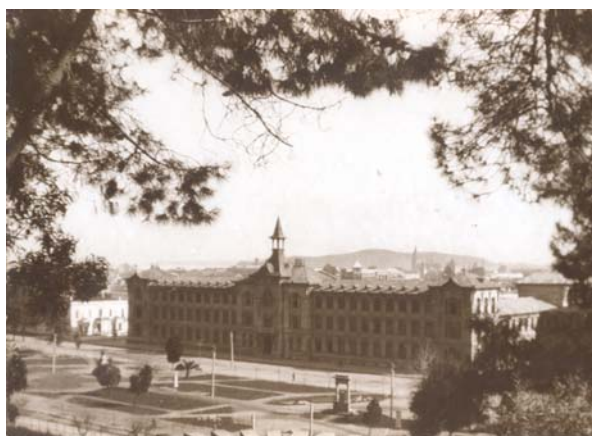
EDIFICIO NEOCLÁSICO c.1915 DESAPARECIDO

El auditorio quedó en abandono a principios de la década del `70, luego de ser la única parte que, junto a los gimnasios, sobrevivió a la demolición del monumental edificio neoclásico. Demolición creemos causada por el desconocimiento de como restaurarlo luego del terremoto de 1960. Este edificio conformaba una fachada de alto valor patrimonial frente al Parque Ecuador, siendo hoy otro más de nuestros patrimonios desaparecidos.