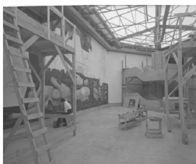
EL MURAL EN PROCESO 2